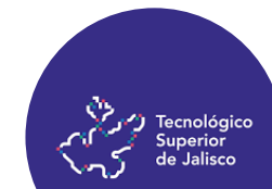
Erika Villa TSJ