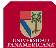
Elias Aguirre UP